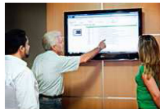
Equipo de expertos de los servicios de asesoramiento (SAM), de Treetech

Treetech invierte 10% de la facturación anual en pesquisa, desarrollo e innovación (P&D). Tal hecho, según datos oficiales, le confiere a la compañía la condición de excepción en un país cuya inversión en el desarrollo de nuevas tecnologías se limitó, en 2008, a 0,58% de la facturación, de acuerdo con datos de la Federación de las Industrias del Estado de Sao Paulo (Fiesp). Tal indicador explica, en parte, por que los desembolsos en P&D en el país — de 1,2% del Producto Interno Bruto (PIB), según datos de 2008 de la Organización para Cooperación y Desarrollo Económico — se situaron abajo del promedio mundial (2% do PIB).