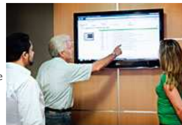
EQUIPE DE ESPECIALISTAS DO SERVIÇO DE CONSULTORIA (SAM) DA TRÉETECH

A Treetech investe 10% do faturamento anual em pesquisa, desenvolvimento e inovação (P&D). Tal fato, de acordo com dados oficiais, confere à companhia a condição de exceção em um país cujo investimento no desenvolvimento de novas tecnologias se limitou, em 2008, a 0,58% do faturamento, de acordo com dados da Federação das Indústrias do Estado de São Paulo (Fiesp). Tal indicador explica, em parte, porque os desembolsos em P&D no país — de 1,2% do Produto Interno Bruto (PIB), segundo dados de 2008 da Organização para Cooperação e Desenvolvimento Econômico — situaram-se abaixo da média mundial (2% do PIB).